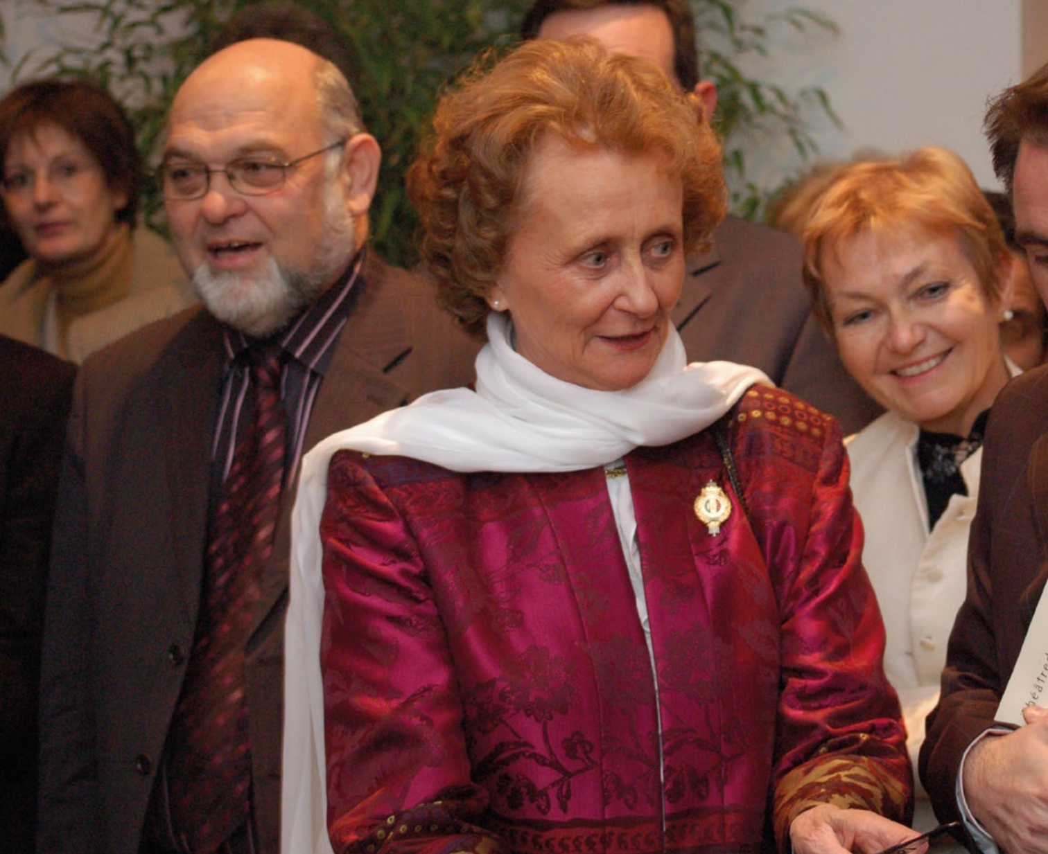
Inauguration du Théâtre du Cormier (28 janvier 2006)