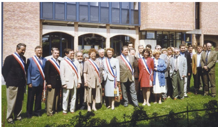
Conseil municipal élu (25 juin 1995)