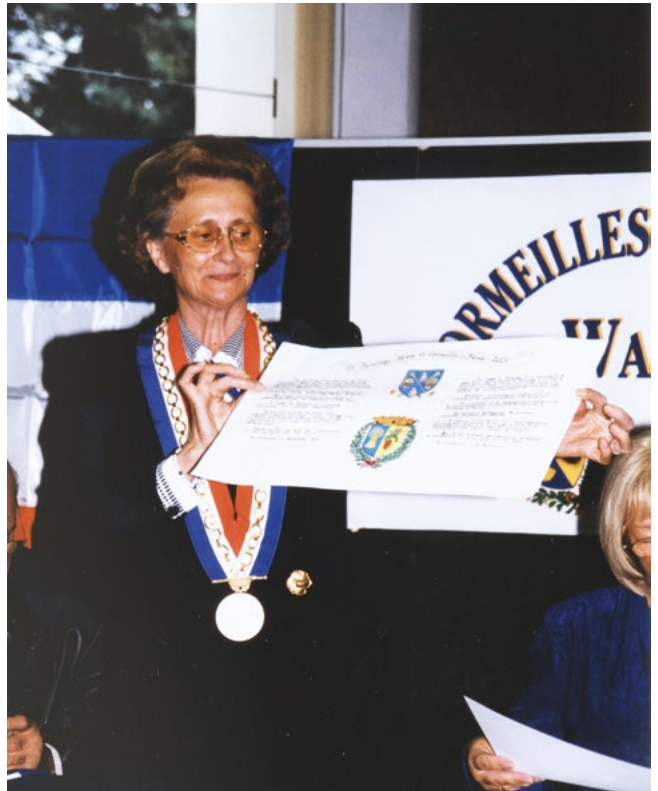
Signature de la charte de jumelage avec Ware (8 septembre 2001)

Inauguration du Théâtre du Cormier et du marché municipal rénové.