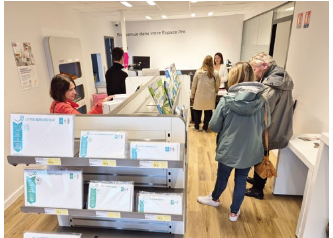
La Poste Espace Pro, 9 rue René Couzinet. Horaires : du lundi au vendredi de 8 h 30 à 12 h et de 14 h 30 à 17 h 15.

Aménagé pour les clients professionnels, l'Espace Pro dispose d'un espace de dépôt courrier en nombre et du service boîtes postales, d'un libre-service avec les produits d'envois courrier et des tables sont mises à disposition pour la finalisation des envois. Les clients professionnels pourront également être accompagnés dans leurs démarches par une chargée de clientèle et un commercial.