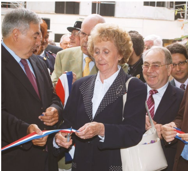
Inauguration du groupe scolaire Saint-Exupéry (1 er septembre 2007)