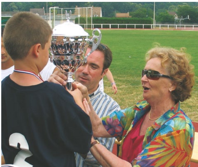
Olympiades intercommunales (25 juin 2005)

« En tant que maire, j'ai travaillé à la construction du complexe Léo Tavares. La ville n'avait pas de vrai gymnase et la salle Émy-les-Prés était saturée. Avec mon adjoint aux sports, on avait donné pour objectif de développer les catégories jeunes dans toutes les sections de l'ACSC. Le sport est important, c'est l'esprit de camaraderie. Il peut totalement changer un enfant. Il faut donner le goût du sport et de l'effort aux jeunes. »