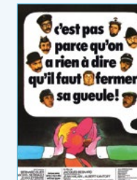
Vendredi 1 er mars