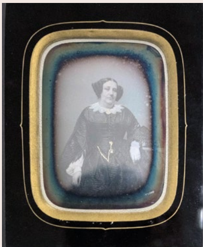
Daguerreotype anonyme (Ville de Cormeilles-en-Parisis)

de ces décors, il s'attelle à la création de dioramas, des toiles peintes des deux côtés sur un support transparent, dont l'image évolue selon les lumières projetées d'un côté ou de l'autre. Le public est impressionné par ces œuvres présentées à Paris dès 1822.