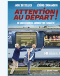
Vendredi 9 février