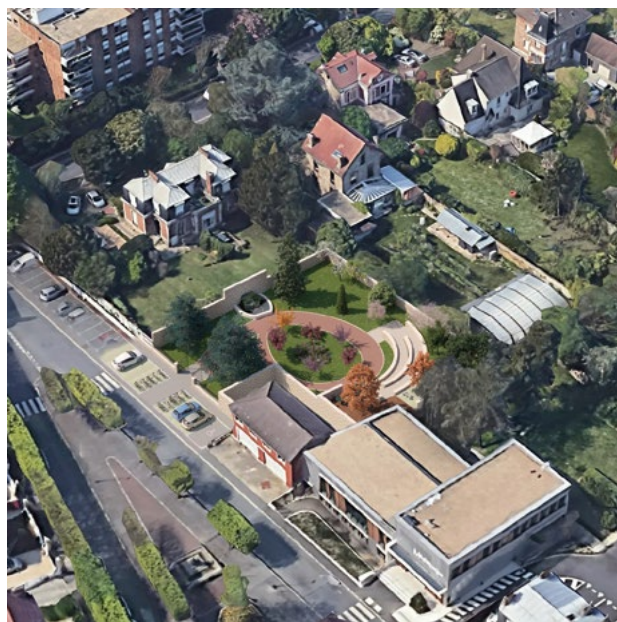
Perspective du futur parc du centre-ville

À terme, cet espace agira comme régulateur climatique en favorisant l'évaporation continue de l'eau et donc en créant un véritable îlot de fraîcheur. Il constituera un réceptacle pour la gestion des eaux pluviales et jouera le rôle d'amortisseur sonore écologique. Le développement d'espaces verts permettra enfin la conservation de niches écologiques sur notre territoire : des clôtures perméables seront mises en place pour faciliter le passage de la petite faune des jardins tel que le hérisson d'Europe (espèce protégée inscrite sur la liste rouge mondiale des espèces menacées) et la récupération de branchages et autres