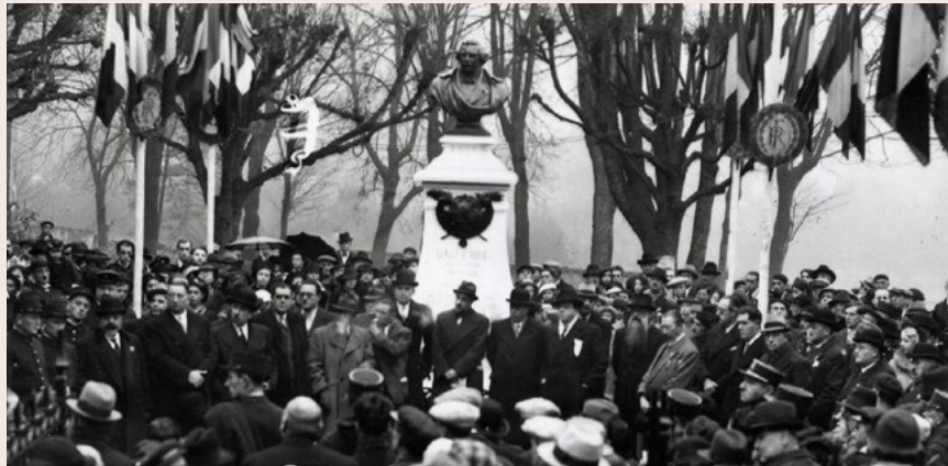
150 ème anniversaire de la naissance de Daguerre, 1937

Un collège, une rue, une statue et un portrait à la mairie... Pourquoi Louis Daguerre a-t-il tant marqué Cormeilles et les Cormeillais ?