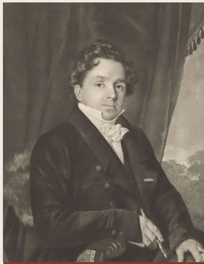
Portrait de Louis Jacques Mandé Daguerre par Millet, gravé par P. Dujardin (Ville de Cormeilles-en-Parisis, œuvre n°071)