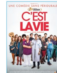
Vendredi 23 février

Henri Cazalis (11, rue du Fort). Inscriptions et renseignements auprès de l'Espace seniors 23, avenue de la Libération (séances gratuites sur inscription) Tél. : 01 88 18 00 30 / 06 07 88 87 12 Début des séances à 13 h 30.