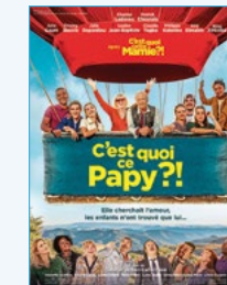
Vendredi 8 mars