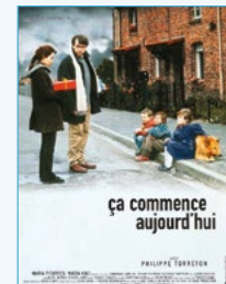
Vendredi 15 mars