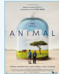
Vendredi 16 février