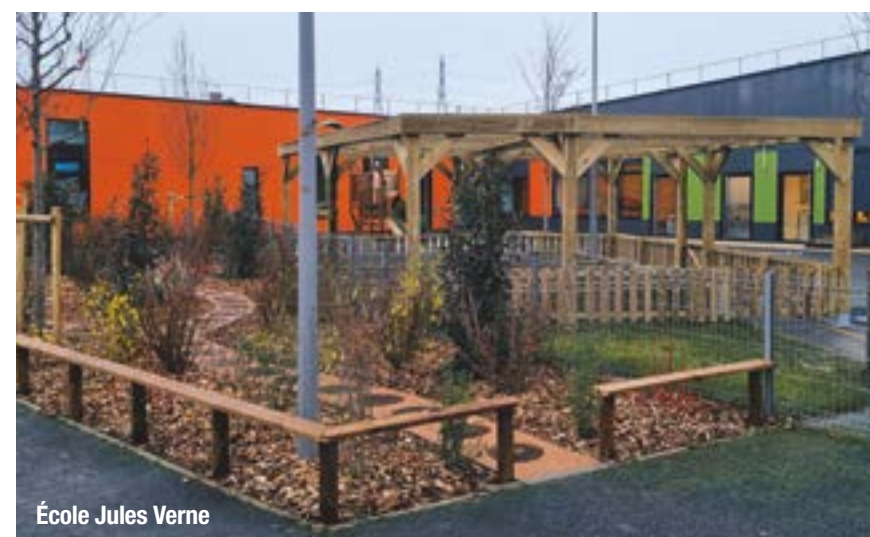
École Jules Verne