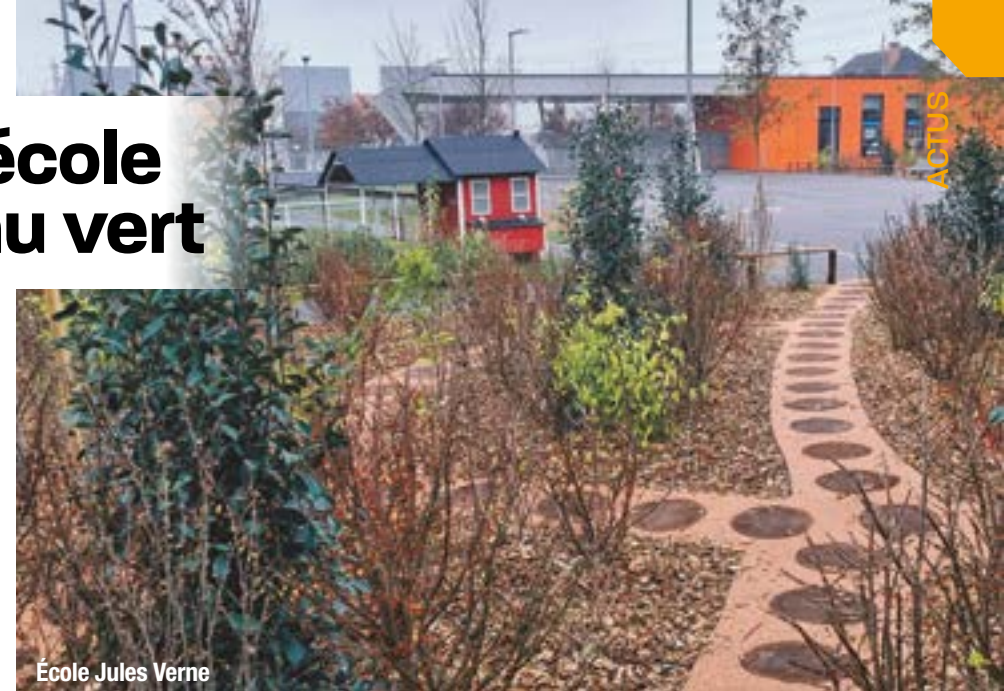
École Jules Verne

Lancé par la ville après consultation des différents usagers, ce programme a débuté l'été dernier par différents aménagements (création d'îlots de passage et de bancs en bois rond autour de certains arbres, pose de sols souples et perméables) dans les six cours d'école (sur seize au total) dont le déficit en espaces verts était clairement identifié : les écoles maternelles et élémentaires Jules Verne et Saint-Exupéry et les écoles élémentaires Maurice Berteaux et du Noyer de l'Image.