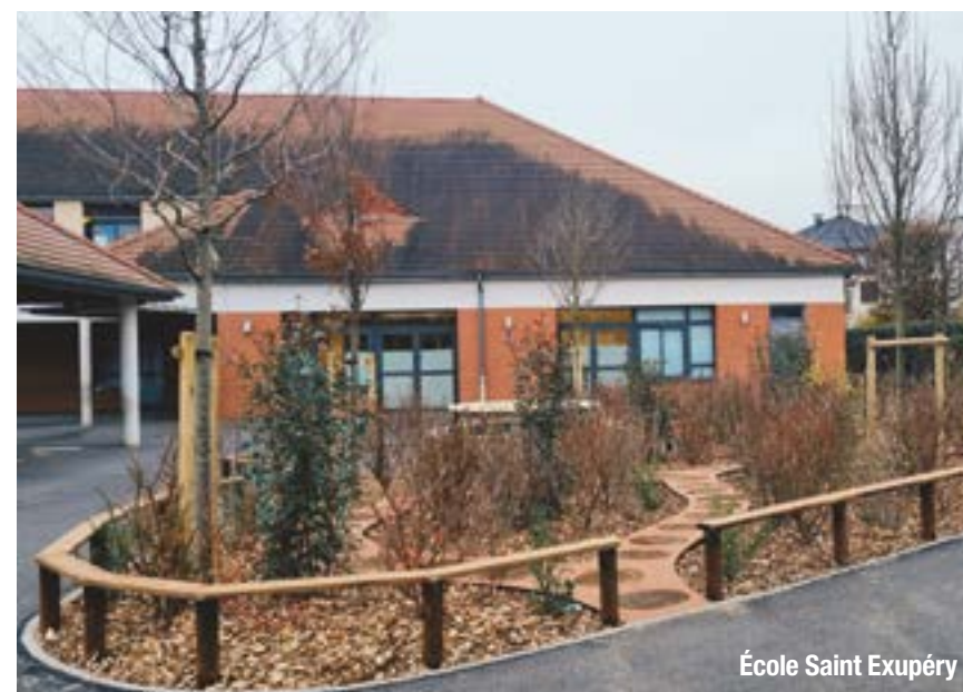
École Saint Exupéry

Cet automne, la ville a pu procéder aux plantations des îlots végétaux, des strates arbustives ou encore au remplacement d'arbres morts.