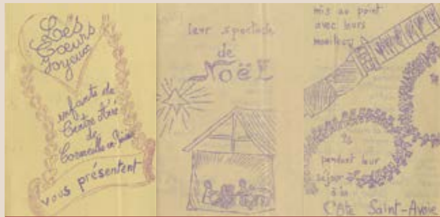
Programme du spectacle de Noël des enfants du centre de loisirs, 1968 (Archives municipales - 1R82)

« Mardi 2 janvier, en arrivant au centre, nous avons tous été émerveillés par la neige qu'on apercevait partout. Les arbres tout blancs donnaient une expression plus gaie à la forêt. [...] Avec les moniteurs nous avons fait une belle bataille de boules de neige quand nous sommes sortis. » (Edith, 13 ans)