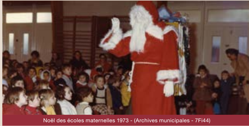
Noël des écoles maternelles 1973