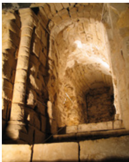
La crypte de l'église Saint-Martin

Samedi 21 septembre, la Ville participe au World Clean Up Day, une journée internationale dédiée au nettoyage de la planète. Cormeilles est riche de son patrimoine naturel, l'or vert de Cormeilles. Sa préservation caractérise la ville d'aujourd'hui et de demain. La gestion