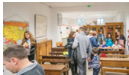
Salle de classe des Musées Réunis

grandes étapes de l'aménagement des quais de Seine. L'historique exploitant industriel Lafarge quittera définitivement le site en septembre 2019. En 2022, Seine Parisii, dont le nom fait référence au peuple gaulois les Parisii, accueillera ses premiers habitants. Un projet qui réunit à la fois le Cormeilles d'hier, aujourd'hui et demain.