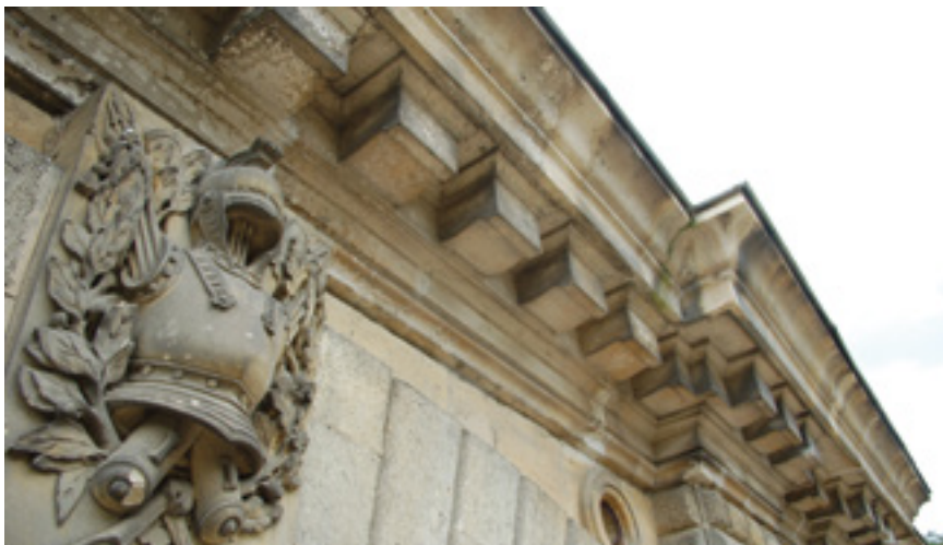
Façade du Fort de Cormeilles-en-Paris

Les arts et la culture seront représentés dans cette nouvelle édition. La pièce « Quelques miettes