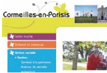
Un nouveau site internet pour Cormeilles p. 6