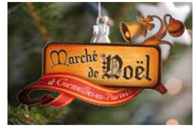
La ville est en fête pour Noël p.12