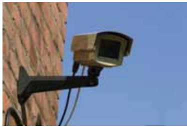
Le dossier du mois : La vidéoprotection p. 4