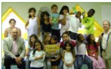
Le centre de loisirs «L'orange bleue» (Argenteuil)

Nous remercions aussi les centres Camélinat, Les enfants d'abord, Côte de St Avoie, et Saint-Exupéry. Rendez-vous l'année prochaine.