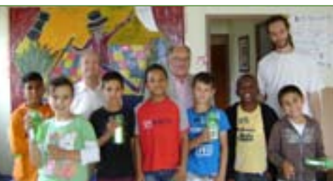
Le centre de loisirs «Gérard Philippe» (Argenteuil)

En juillet, le Syndicat AZUR a organisé un concours auprès de six centres de loisirs du territoire. Le principe était de composer une chanson sur le thème du tri et du recyclage d'une durée de deux à trois minutes. Entre le titre de la chanson, le nombre de chanteurs, le choix des décors, costumes et de la musique, un seul mot d'ordre : Liberté ! A ce petit jeu, le centre de loisirs « Fort Boclub » (La Frette-sur-Seine) a décroché le premier prix. « Gérard Philippe » (Argenteuil) finit deuxième et « L'Orange Bleue » (Argenteuil) troisième. De nombreux lots ont récompensé les participants pour leur talent.