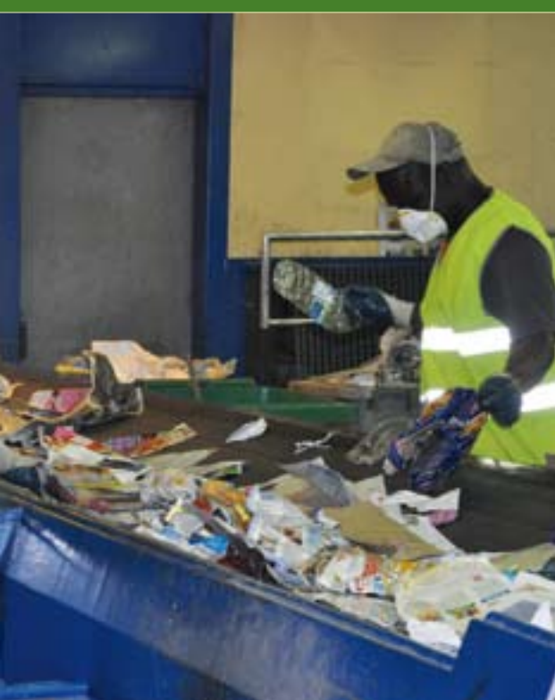
de 15000 tonnes de déchets par an (dont 4000 pour le syndicat tri optique débute la plus grande récupération manuelle.