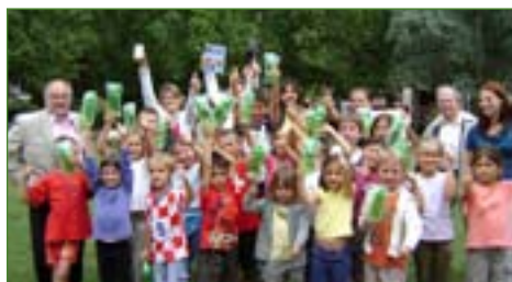
Le centre de loisirs « Fort Boclub » (La Frette-sur-Seine)