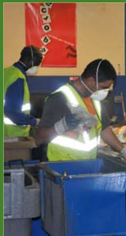
Une équipe de seize personnes assure le tri... Azur. Après le passage au paper spike et au...

À sa sortie de cabine, il ne reste plus grand-chose sur le tapis. L'Overband récupère à l'aide d'un aimant les métaux ferreux, envoyés vers une presse à paquets formant des « sucres » d'acier. Seuls persistent les refus de tri et les emballages métalliques en aluminium qui ne sont pas sensibles aux champs magnétiques. La machine à Courants de Foucault récupère automatiquement l'aluminium. Il s'agit d'une roue polarisée qui tourne à 2600 tours par minute, à côté du tapis sur lequel circulent les déchets. Composée en périphérie de pôles d'aimant nord et sud alternés, la machine crée un champ magnétique alternatif qui provoque l'éjection de modules d'aluminium. Chaque produit est ainsi conduit dans des dix alvéoles de stockage, puis poussé vers la presse à balle. Ultime étape, cette machine compacte les déchets selon un poids de 250 à 500 kg avant leur départ vers les usines de recyclage spécialisées.