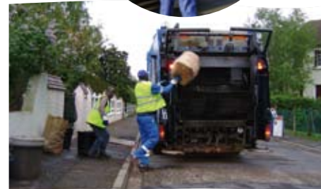
Collecte des déchets végétaux à Cormeilles-en-Parisis et La Frette-sur-Seine: comme le montrent ces photos, les déchets déposés dans des conteneurs non fermés (poubelles ou bacs sans couvercle) sont acceptés de même que les fagots de branchages ficelés.